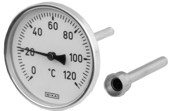
Биметаллический термометр Модель 45